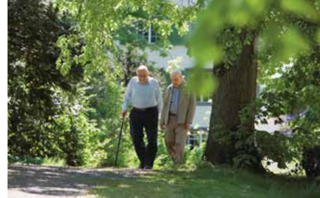
Kompetenzzentrum Gesundheit und Alter