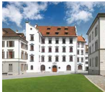
Stadthaus der Ortsbürgergemeinde