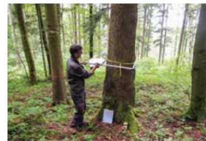
Wald- und Forstwirtschaft