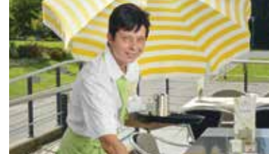
Arbeiten bei der Ortsbürgergemeinde