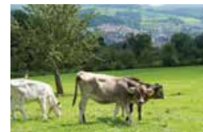
Leben im Grünen Ring