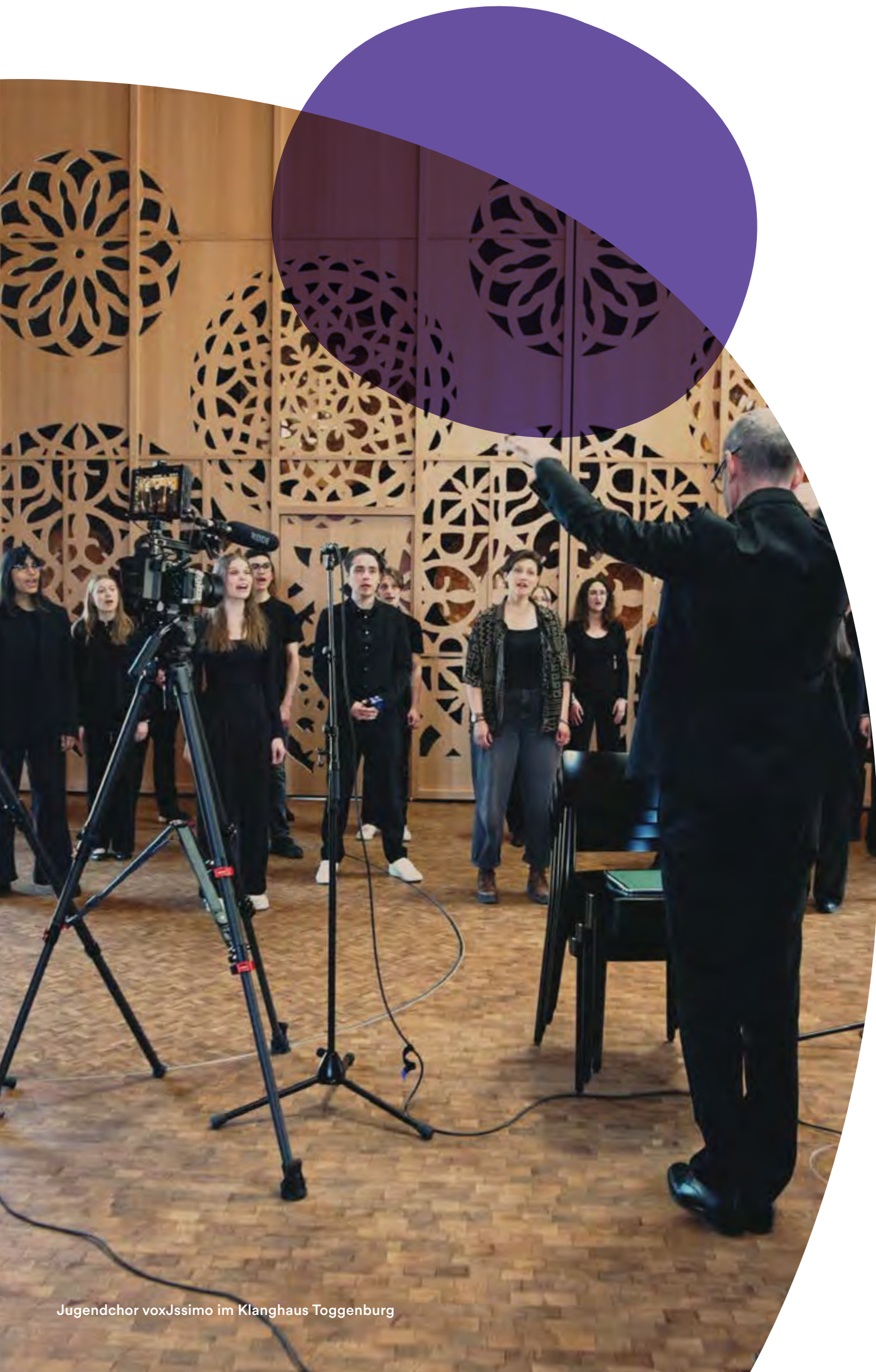
Jugendchor voxJssimo im Klanghaus Toggenburg