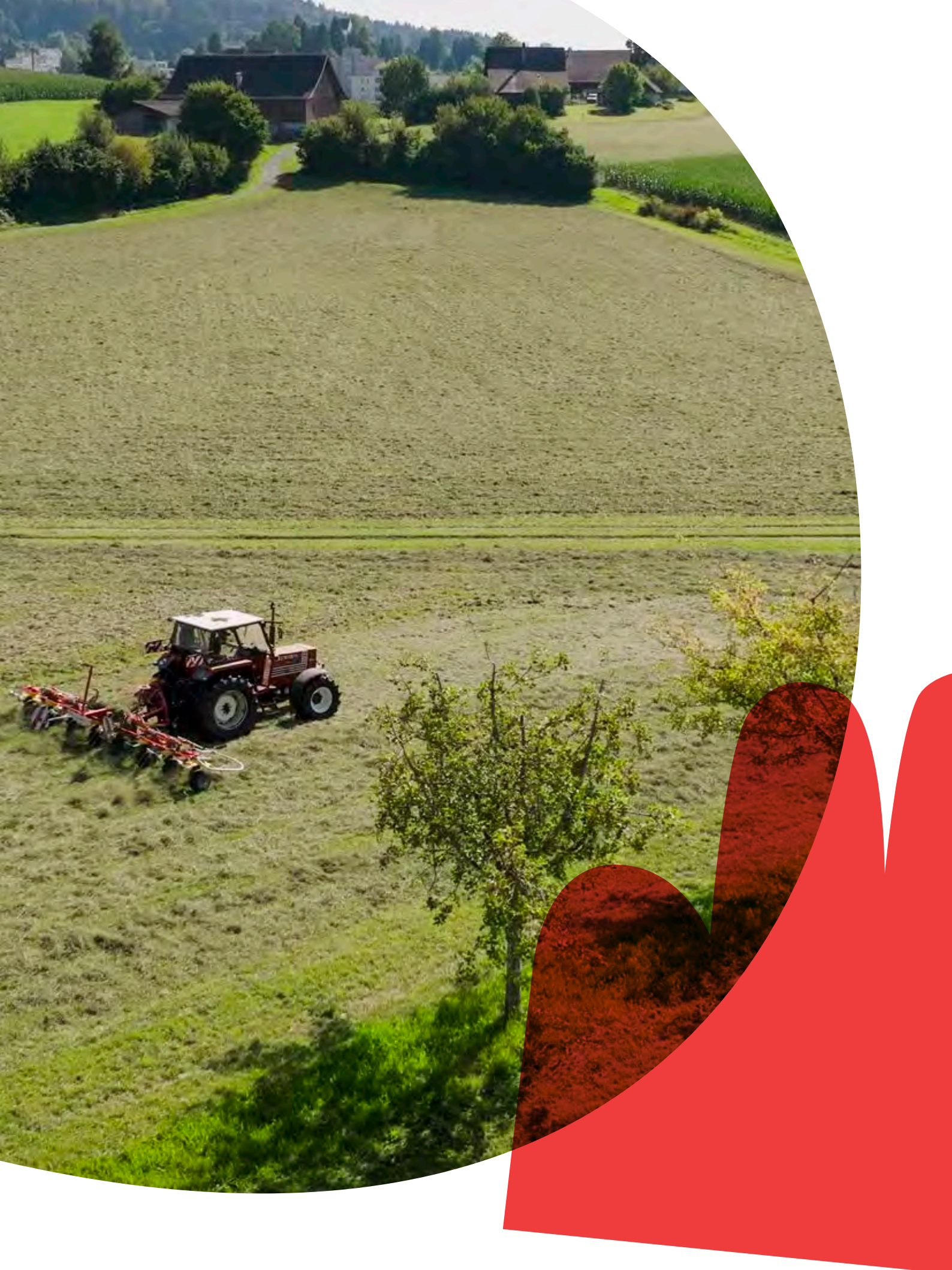
Heuernte auf dem Landwirtschaftsbetrieb Kappelhof.