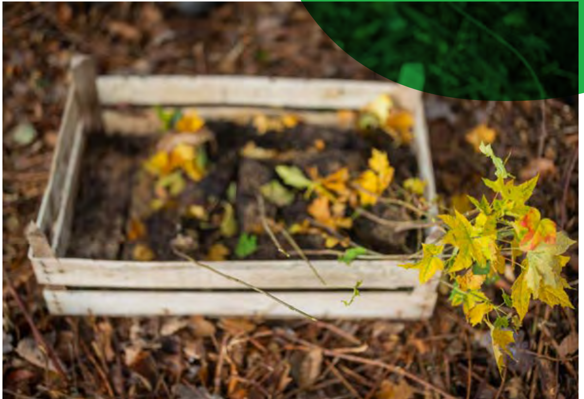
Baumpflanz-Saison im ortsbürgerlichen Wald.