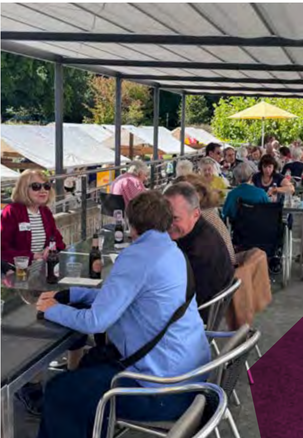
Bewohnerinnen und Bewohner am Herbstfest

Am Tag der offenen Tür im Oktober wurden rund 800 Besucherinnen und Besucher im Wohnen am Singenberg begrüsst. An zehn Informationsständen präsentierten alle Berufsgruppen, gemeinsam mit Vertreterinnen des Bewohnendenrates, ihr Können, ihre Leidenschaft und ihren Alltag im Wohnen am Singenberg. Trotz des Ansturms blieb der Alltag der Bewohnenden weitgehend ungestört. Das versierte Küchenteam verpflegte die Gäste mit 30 Kilogramm feinem Risotto und über 500 Bratwürsten. Eine der vielen Rückmeldungen lautete: «Man spürt die Begeisterung der Mitarbeitenden, ihre Freude an der Arbeit und die besondere Stimmung in den Häusern.»