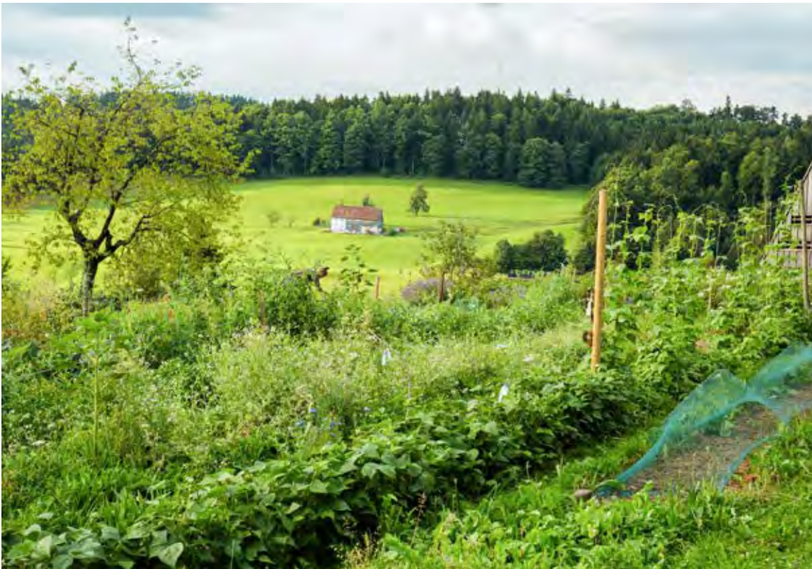
Gemüseanbau in der Vorderen Bernegg