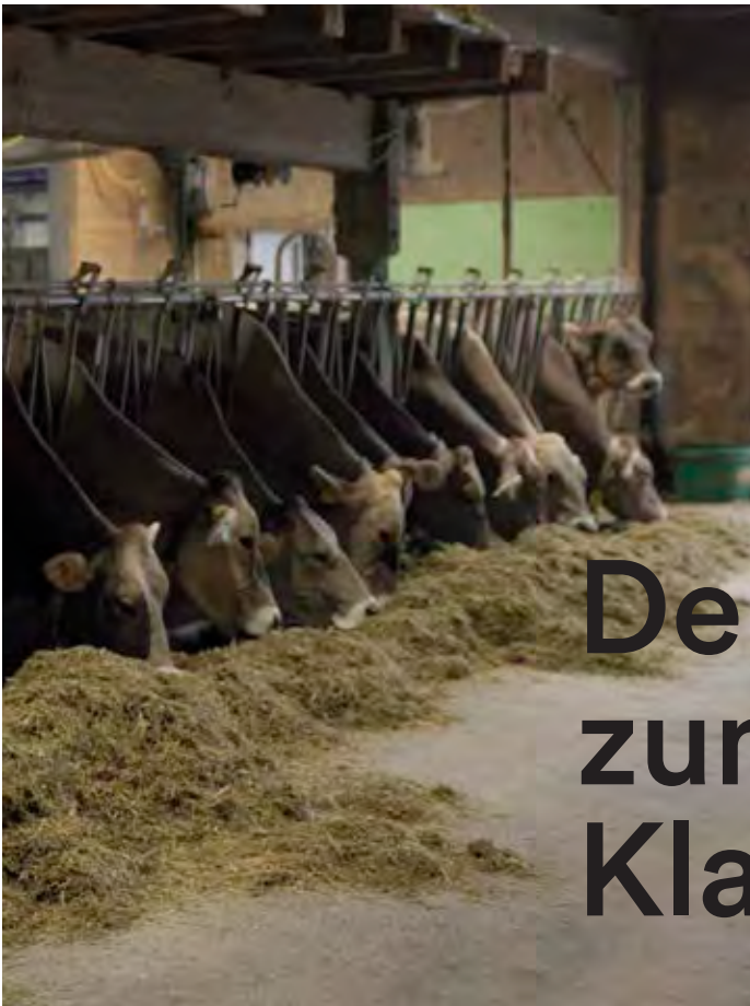
Kuhstall im Kappelhof

Ergänzend zur Feldproduktion werden auf dem Bernegghof in einem lebendigen Miteinander auch Schafe, Hühner und Laufenten gehalten sowie Wildbienen und andere Nützlinge gefördert. bernegghof.ch