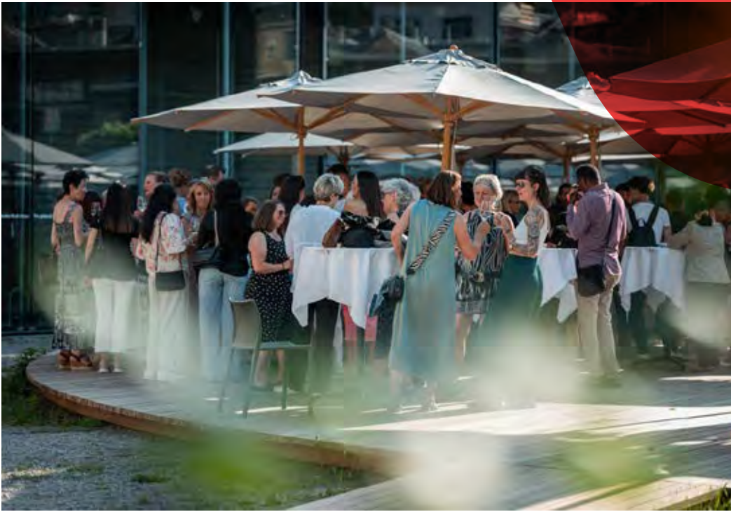
Personalfest in der Lokremise