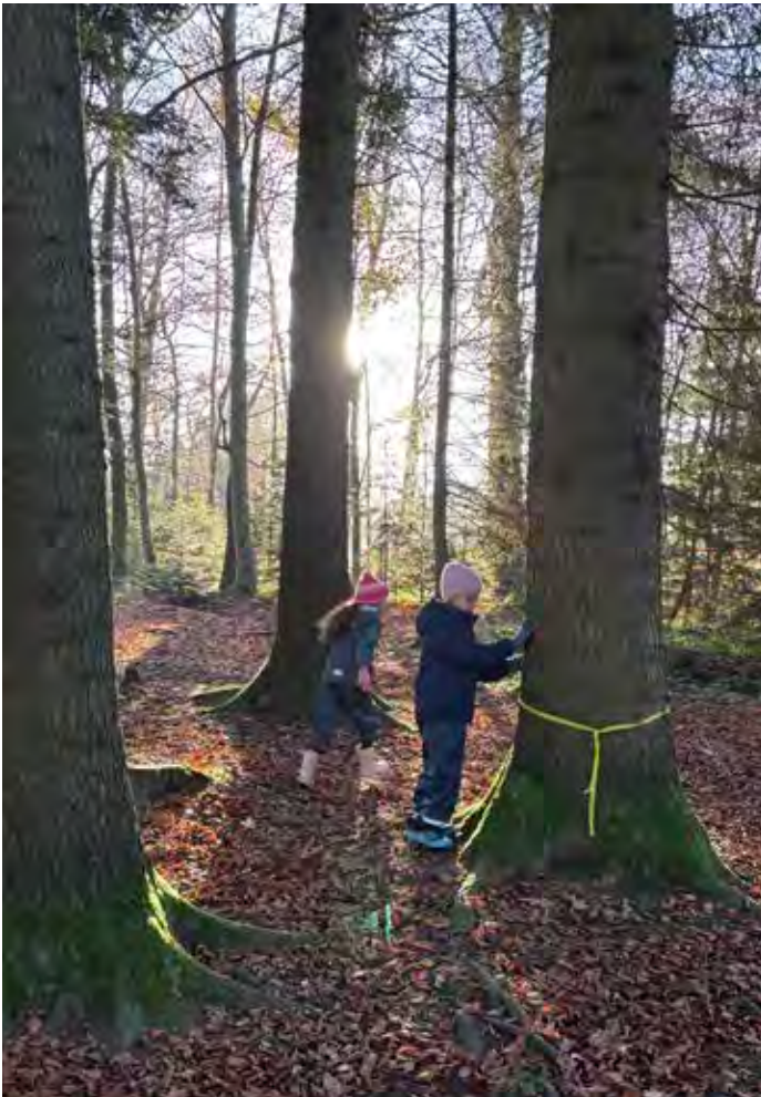
Naturschule: aktives Lernen im Wald.