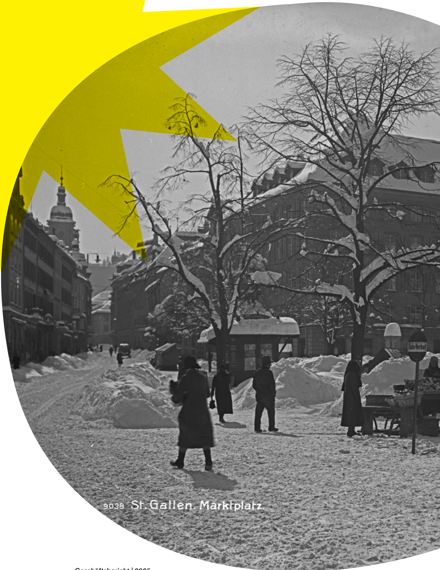
9038 St. Gallen. Marktplatz.