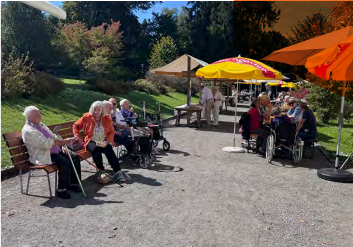
Sonniger Nachmittag im Singenbergpark