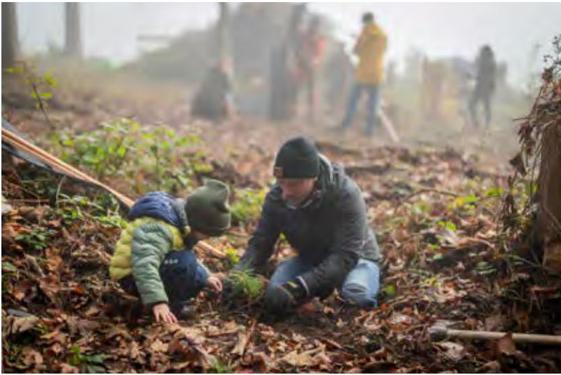
Baumpflanztag für junge Familien

Die Ortsbürgergemeinde lebt vom Mitwirken vieler Bürgerinnen und Bürger, die sich aktiv am Stadtleben beteiligen.