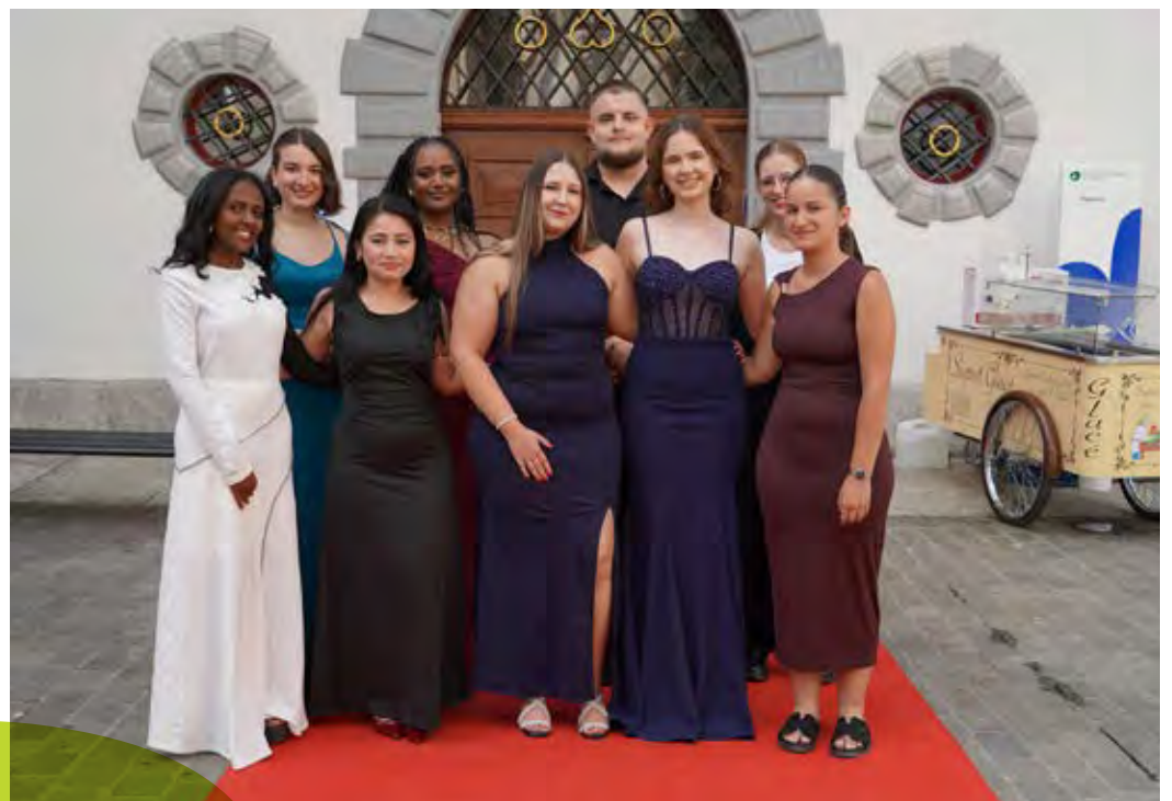
Lehrabschlussfeier im Stadthaus